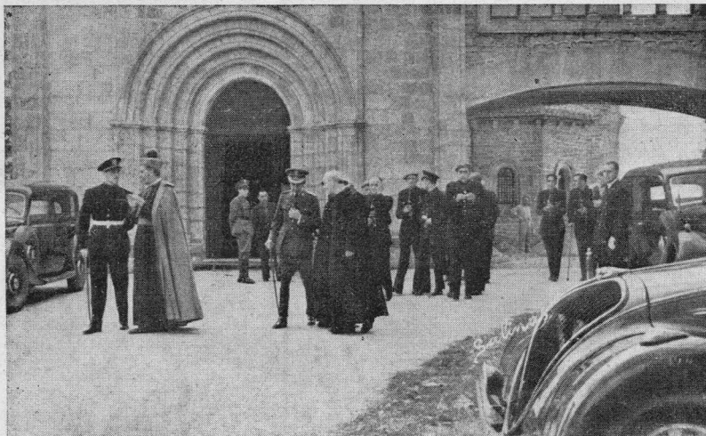
Los nuevos diputados alaveses abandonan la Basílica, después de haber orado ante la imagen de la Patrona celestial de toda la Provincia.

Ha habido algunas peregrinaciones colectivas, entre las que destacamos la de los niños y niñas de las escuelas de Victoria. Los primeros, vinieron el 14 de julio, en número de trescientos, y las se-