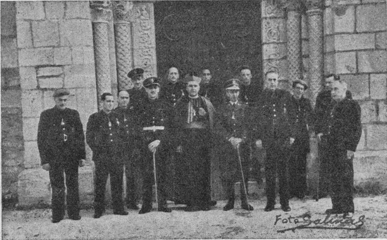
Los nuevos diputados alaveses, con los Excmos. Sres. Administrador Apostólico de la Diócesis de Vitoria y Gobernador de la Provincia, ante la puerta "Speciosa" de la Basílica de Estibaliz