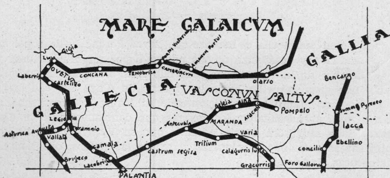
Red de las Vías romanas del Norte. (Mapa de José Maria de San Román).

se utilizaba para la construcción de las lápidas, como más resistente a la acción del tiempo. De esa clase de piedra caliza son los sillares-lápidas cuyo frente tenemos a la vista, y de la misma esos otros sillares que presentan el dorso.