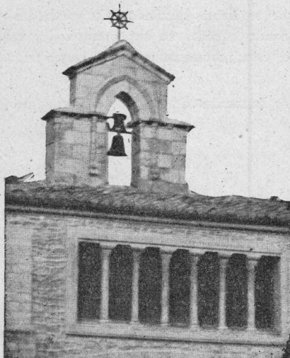
La antigua espadaña que remataba la torre de Estíbaliz, levantada sobre el muro Este del Monasterio benedictino.

Con algunas pequeñas modificaciones, se ha levantado sobre el muro Este del Monasterio la espadaña que sirvió de remate a la torre desde el año 1906 a 1941, en el que fué derribada por el ciclón del mes de febrero.