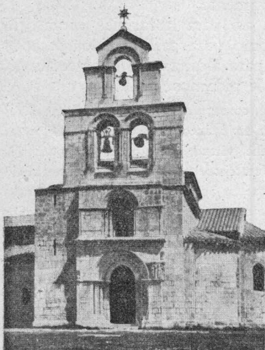
La torre de Estíbaliz antes del ciclón de 1941.

GRANDES andamios se han visto en Estíbaliz durante todo el verano pasado fuera y dentro de la Basílica, por lo que hemos oído formular a muchos visitantes éstas o parecidas preguntas: ¿Qué es lo que están haciendo? ¿Acaso, amenazaba ruina alguna bóveda? ¿Habrá habido algún corrimiento de tierra en torno de los ábsides?