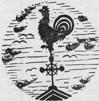
El Gallo simbólico.