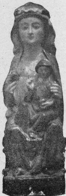
Imagen de Nuestra Señora de Angosto.

Por desgracia, la primitiva imagen de Nuestra Señora de Angosto no ha llegado hasta nosotros. La que actualmente se venera en Angosto pertenece a la escuela gótica del siglo XIV, que tan pródigo ha sido en España de este tipo de imágenes. Está finamente ejecutada y muéstrase al devoto con un continente amable y maternal. El Niño Jesús descansa sobre la rodilla izquierda de la Madre y levanta su mano derecha en actitud de bendecir. Esta artística talla de Nuestra Señora está hoy recubierta de postizos vestidos.