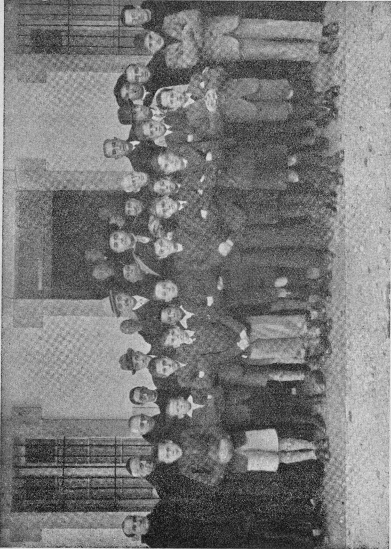
Monseñor Lauzurica y las Autoridades de Alava y Vitoria, rodeados de la Comunidad Benedictina y de los primeros alumnos de la Escuela Monástica de Estibáiz el día de su inauguración oficial.