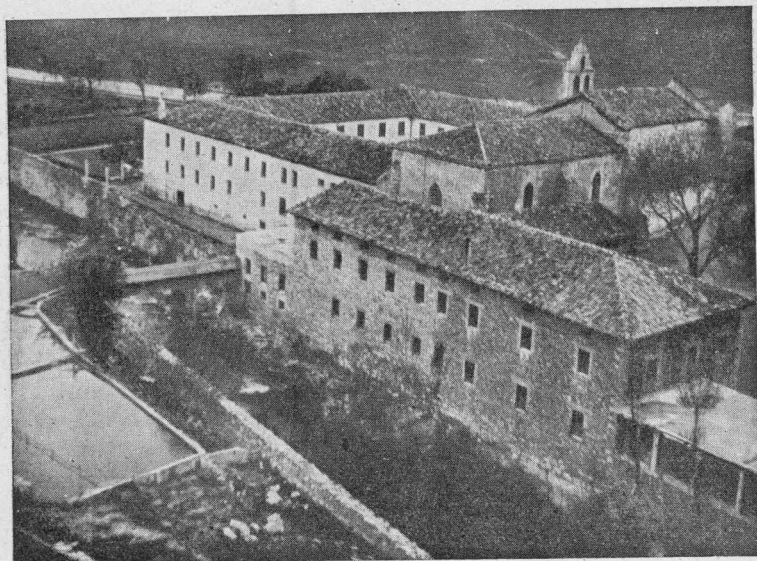
Vista parcial del Santuario de Nuestra Señora de Angosto.

Al servicio del Santuario de Angosto se ha constituido un convento-retiro, en el que vive una observante comunidad de religiosos Pasionistas. Merced a su laboriosidad se ha reconstruido y agrandado el edificio conventual así como la iglesia. Esta última pertenece al estilo gótico, con bóveda de crucería y tres tramos. En el retablo, parte del cual es obra del siglo XVI, está el camarín de Nuestra Señora de Angosto.