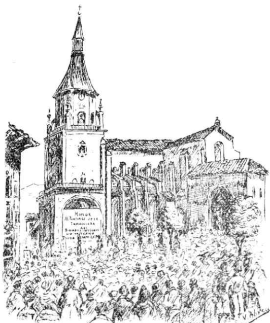
La imagen de Santa María de Estibaliz preside las solemnes fiestas de 1871, en Vitoria (Dibujo del Excmo. Sr. D. Vicente Abreu)

y el sábado, así como también a asistir con devoción y recogimiento a los templos donde se celebrasen funciones religiosas. Desde la tarde del viernes y todo el sábado no se veía otra cosa por las calles sino preparativos para la iluminación de la noche: nadie hablaba de otra cosa: vino la noche y la iluminación fué todo lo completa, todo lo hermosa que se podía desear y mucho más de lo que se podía esperar. Muchas casas