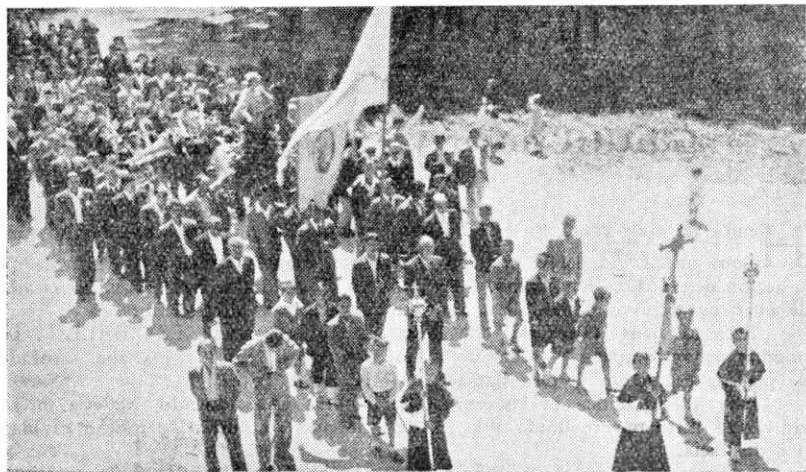
Procesión a la ermita de Santa Lucía de Zaldueño el año 1946

No parece gran temeridad afirmar que la actual ermita es expresión reducida de una iglesia anterior, pues su piedra sillaría de tamaño desproporcionado, la cornisa saliente que tal vez fué botaaguas, los canecillos y algún resabio del románico parecen indicarlo. Tiene pila bautismal, donde se ha seguido la costumbre de bautizar hasta época bien reciente. En el primer libro de partidas bautismales de la parroquia de Zaldueño consta que en el año 1550 era aneja a dicha parroquia, con capellán propio residente en Zaldueño.