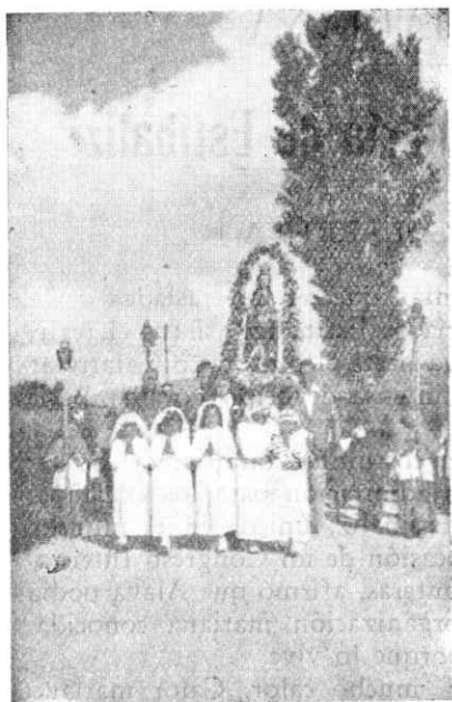
Santa María de Estíbaliz es trasladada triunfalmente de Amérga a Galarreta.

lució como nunca su envidiable retablo, puro barroco, realzado por el brillo de la púrpura y el oro que lo decoran.