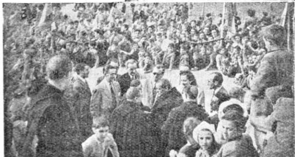
3.—La peregrinación infantil de Victoria, presidida por las Autoridades, en Estibaliz.