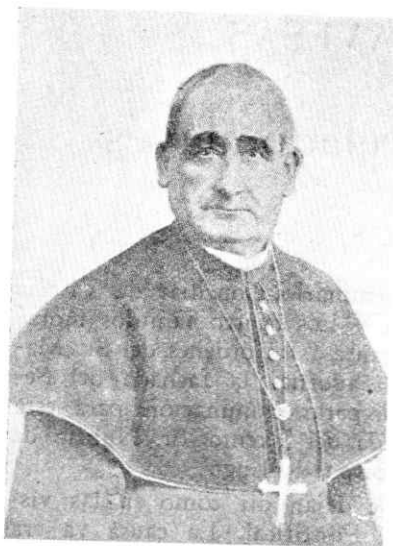
Excmo. D. Francisco Sáenz de Urturi, último Arzobispo español de Santiago de Cuba de la dominación española.

Nació el 4 de Enero de 1842 en el pueblo ya citado y mostrando una especial inclinación a la piedad y al estudio, mandáronle sus padres a estudiar latín al próximo pueblo de Urarte, donde, con notable aplicación, concluyó sus estudios de gramática bajo la dirección del distinguido humanista Sr. Rández. En 1857 dió principio al estudio de la Filosofía en el Seminario eclesiástico de Aguirre y apenas la terminó, cuando, llamado por Dios, ingresó en el Convento de PP. Franciscanos de Bermeo. Concluido el Noviciado continuó su carrera en las otras facultades propias de la eclesiástica y una vez concluida explicó filosofía.