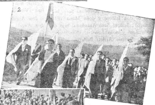
2.—Los jóvenes vitorianos de Acción Católica, suben en peregrinación de penitencia para postrarse ante nuestra celestial Patrona.