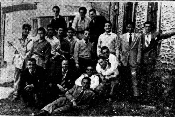
1.—Congregantes marianos de Jesús Obredo 2.—El "Real Valladolid" en su visita a Estibaliz

exhortando a todos a cultivar con entusiasmo la devoción a Santa María de Estibaliz.