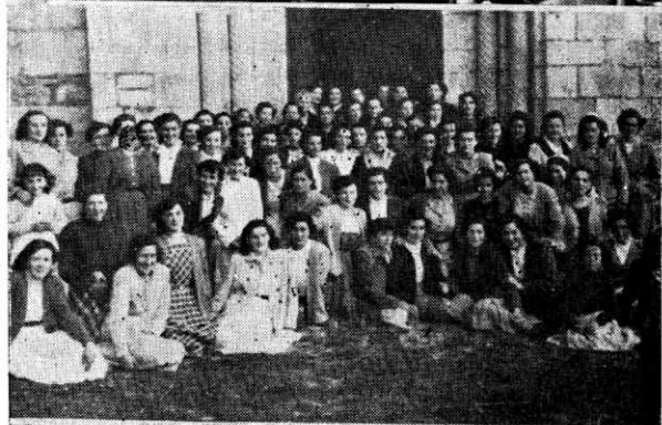
Diversos aspectos de la concentración de Propagandistas de nuestra Revista