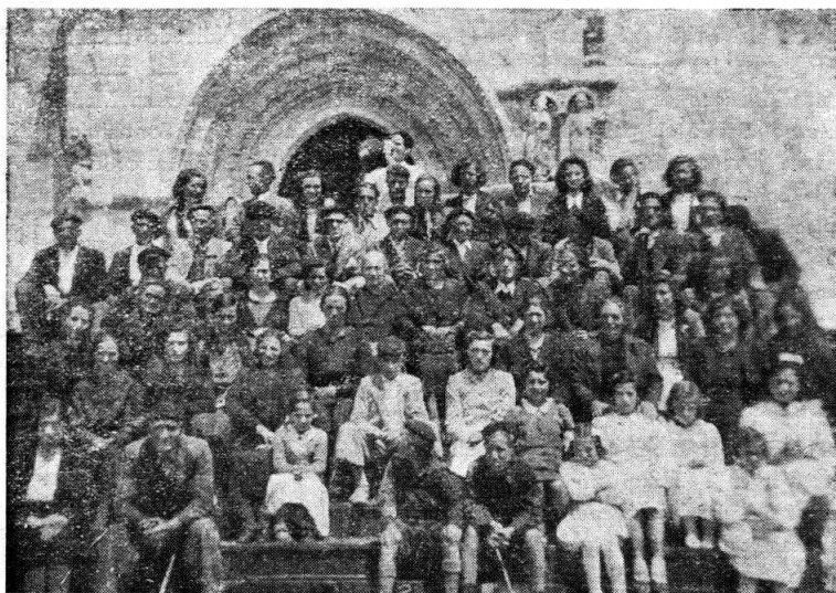
Peregrinación de Ozaeta