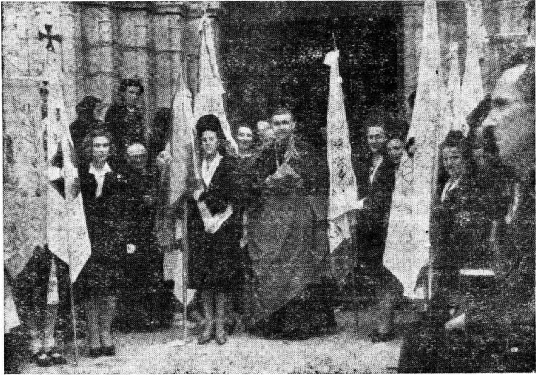
El Excmo. Sr. Obispo de Vitoria, en Estibáliz, el día de la peregrinación de las jóvenes alavesas