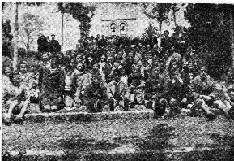
Peregrinación de Oreítia, Villafranca, Argandoña y Matauco